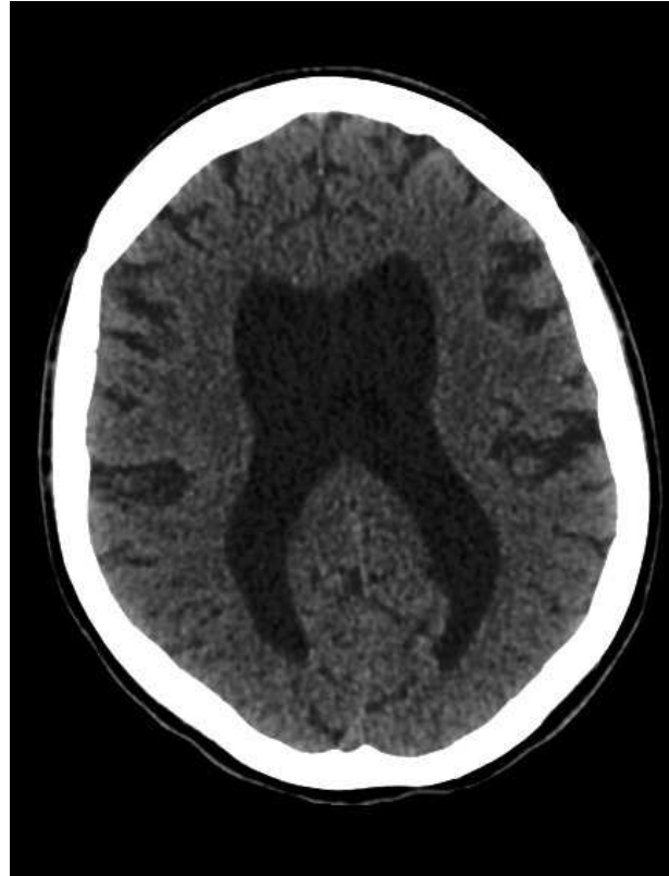
Рис. 2. Данные СКТ головного мозга больной К. после 50 дней лечения токсоплазмоза

ренз). Начало противовирусного лечения больная перенесла хорошо, симптомов развития СВИС не зафиксировано. На фоне сочетанной терапии состояние пациентки продолжало медленно улучшаться, и через 50 дней лечения токсоплазмоза была выполнена контрольная СКТ головного мозга. На контрольной томограмме определялась выраженная положительная динамика полного рассасывания зоны патологической плотности в области таламуса слева, сохранялось симметричное расширение желудочков головного мозга (рис. 2.). При объективном осмотре отмечалось значительное улучшение неврологического статуса: сознание восстановилось полностью, больная контролирует функции тазовых органов и обслуживает себя самостоятельно. Продолжали определяться явления левостороннего прозопареза, правостороннего гемипареза (легкий в ноге, умеренный в руке), поражение III пары черепно-мозговых нервов слева, умеренные когнитивные нарушения.